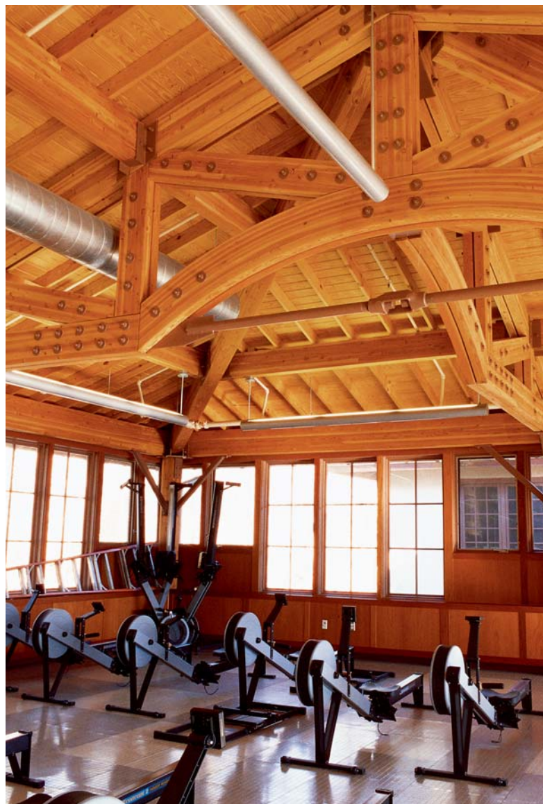
ARRIBA: La viga laminada es muy utilizada en los sistemas estructurales de los espacios recreativos. Cobertizo para botes, Princeton University, EE.UU.