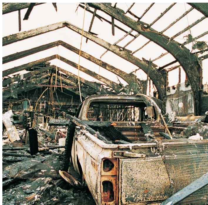
IZQUIERDA: Dos niveles de arcos de vigas laminadas se levantan a más de 24 metros en su punto más elevado, en la sala Great Buda Hall de Carmel, Nueva York, EE.UU.

Con esta y otras lecciones, la meta ahora es la de un diseño “seguro en caso de incendio”, en lugar de “a prueba de incendio”, y puede lograrse con materiales estructurales combustibles, siempre y cuando se cumplan las disposiciones de los reglamentos de construcción. Además de los materiales estructurales, debe considerarse la combustibilidad del contenido y mobiliario, acabados interiores, el grado de protección proporcionado por los rociadores interiores y la disponibilidad de equipo adecuado de extinción de incendios. También los detectores de humo fiables con sistema de alarma y las salidas de fácil acceso son vitales para proteger los edificios y a sus ocupantes.