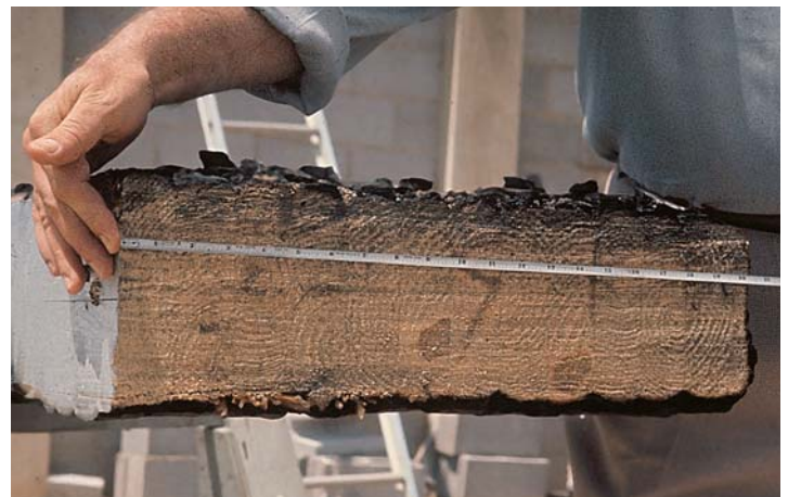
CENTRO: Viga laminada normal envuelta en llamas durante una prueba estándar de exposición al fuego ASTM E-119.